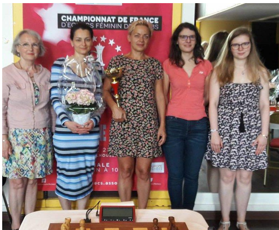
Clichy-Echecs, l'équipe championne de France du Top 12F 2018