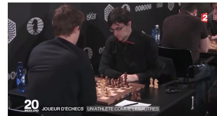
20h France 2