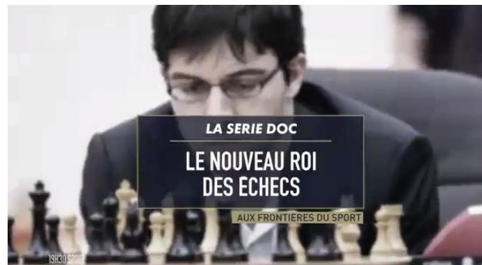
Canal + Sport