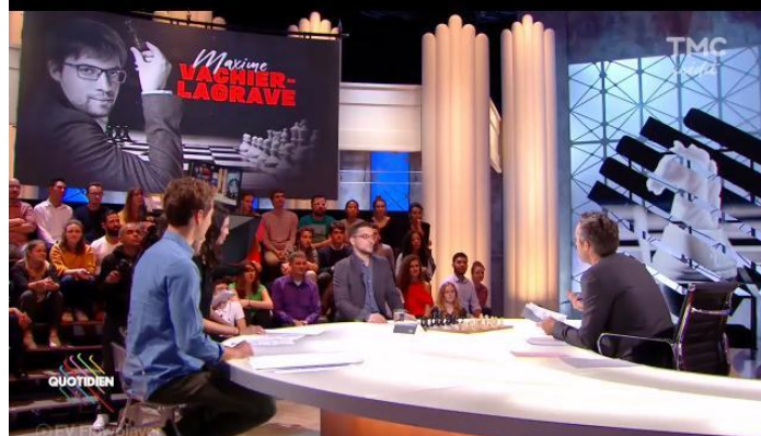
« Quotidien » Yann BARTHES